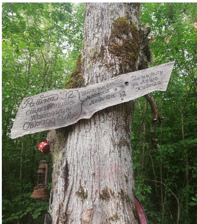
Споменик и дрвена спомен-плоча која свједочи о убиству породице Обрадовић