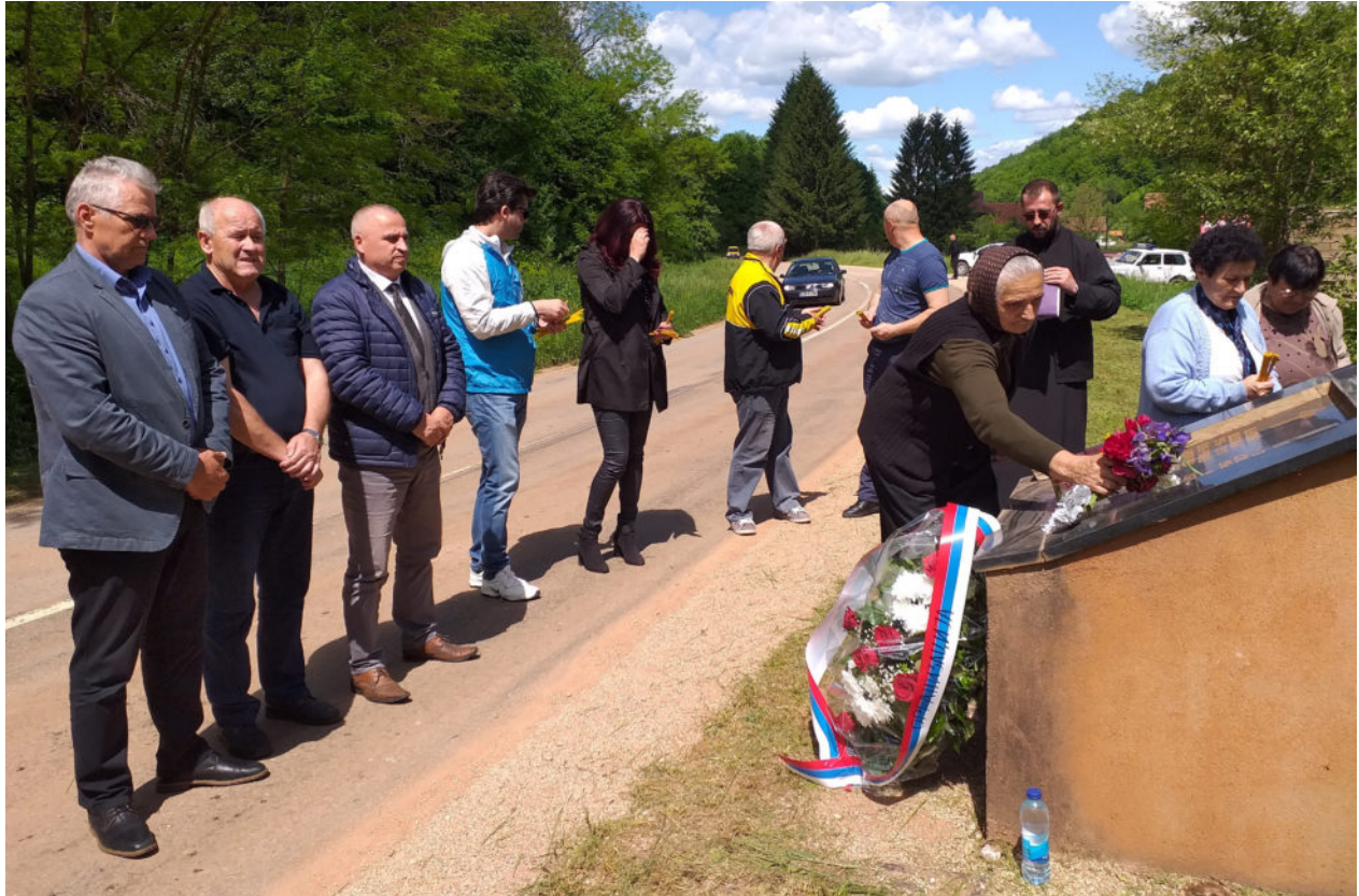
Комеморација убијеним Србима у Жутици код нове спомен-плоче