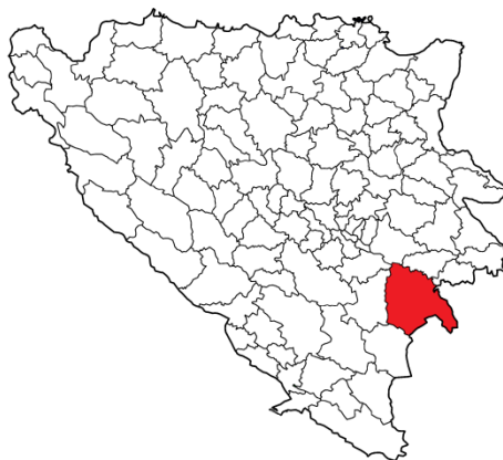
Географски положај општине Фоча 1991. године.

Општина Фоча се налази у југоисточном дјелу Босне и Херцеговине. Граничи се са Републиком Србијом те општинама: Гацко, Калиновик, Трново, Пале, Горажде и Чајниче 1 . Према попису становништва 1991. године површина општине износила је 1.303,98 km 2 . Општина је била састављена од 23 мјесне заједнице: Алаџа, Брод, Брод на Дрини, Центар, Челебићи, Челиково Поље, Чоходак Махала, Доње Поље, Драгочава, Годијено, Горње Поље, Јабука, Јелеч, Јошаница, Козја Лука, Кратине, Мештревац, Миљевина, Попов Мост, Слатина, Устиколина, Викоч и Заваит. У овим мјесним заједницама су се налазила следећа насељена мјеста: Анђелије, Бастаси, Бавчићи, Белени, Бешлићи, Биоково, Биротићи, Богавићи, Борје, Боровинићи, Брајићи, Брајковићи, Брод, Брусна, Будањ,