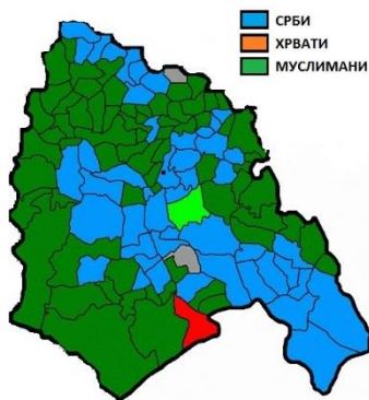
Резултати пописа становништва 1991. године.

Бујаковина, Бунчићи, Бунови, Церова Раван, Црнетићи, Цвилин, Челебићи, Челиково Поље, Ђурево, Даничићи, Деролово, Доње Жешће, Драче, Драгочава, Драгојевићи, Драгомилићи, Ђеђево, Фалиши, Филипковићи, Фоча, Глушца, Годијено, Гостичај, Говза, Градац, Грандићи, Грдијевићи, Хум, Хусеиновићи, Игоче, Избишно, Јабука, Јасеново, Јечмишта, Јелеч, Јошаница, Колаковићи, Колун, Косман, Козаревина, Козја Лука, Кратине, Крна Јела, Крушево, Кундуци, Куново, Кута, Локве, Љубина, Марevo, Мазлина, Мазоче, Мештревац, Миљевина, Мирјановићи, Мјешаји, Мрављача, Њухе, Орахово, Папратно, Патковина, Паунци, Петојевићи, Подградје, Пољице, Попов Мост, Потпеће, Превила, Преврач, Приједјел, Присоје, Пуриши, Рачићи, Радојевићи, Ријека, Родијел, Слатина, Славичићи, Сорлаци, Стојковићи, Сусјешно, Шкобаљи, Штовић, Шуљци, Течићи, Тјентиште, Тодјевац, Тохољи, Трбушће, Тртошево, Тврдаци, Устиколина, Веленићи, Викоч, Витине, Војновићи, Врањевићи, Врбница, Вучево, Вукушићи, Забор, Закмур, Заваит, Зебина Шума, Зубовићи и Жељево.