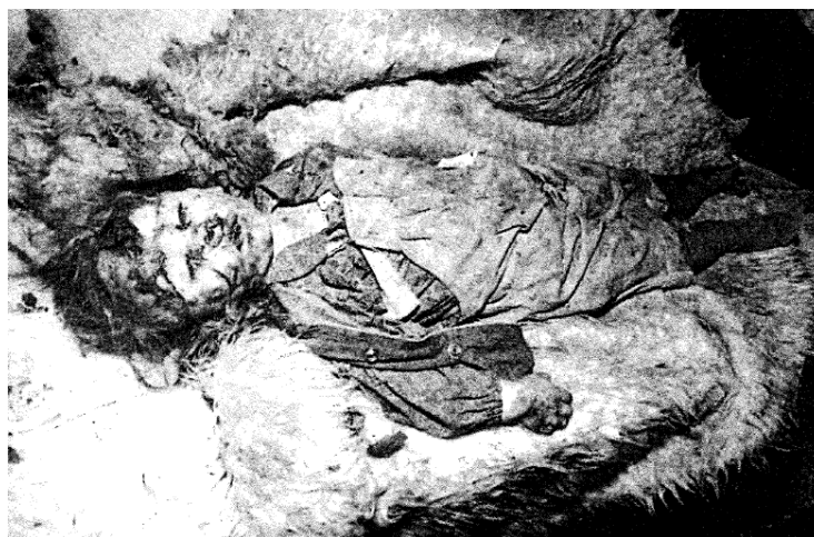
С лијева на десно: Фотографија Данке Секуловић; Данкино тијело након погибије