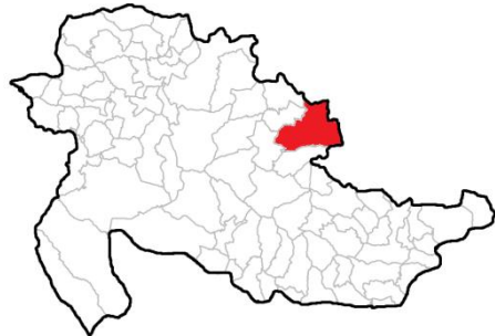
Географски положај Ратковића

Ратковићи су мјесто у општини Сребреница. Укупна површина насеља износи 13,49 km 2 . Према резултатима пописа из 1991. године у Ратковићима је живјело 338 становника од чега је 337 (99,7%) становника било српске националности. Према резултатима пописа из 2013. године у Ратковићима живи 45 становника од чега су 44 (97,8%) Срби.