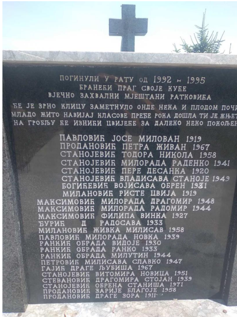
Споменик жртвама Ратковића (фотографисан јуна 2022. године)