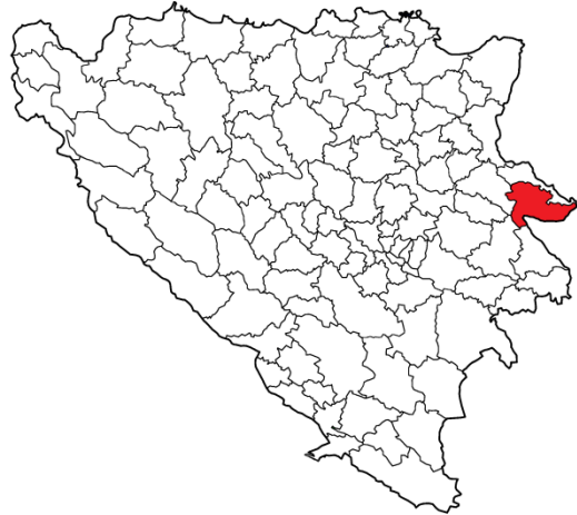
Географски положај општине Сребреница

Општина је била састављена од 19 мјесних заједница: Брежани, Црвица, Гостиљ, Костоломци, Крњићи, Лука, Ораховица, Осатица, Подравно, Поточари, Радошевићи, Ратковићи, Сасе, Скелани, Скендеровићи, Сребреница, Сућеска, Топлица, Виогор. У овим мјесним заједницама су се налазила сљедећа насељена мјеста: Бабуљице, Бајрамовићи, Беширевићи, Блажијевићи, Бостаховине, Божићи, Браковци, Брезовице, Брежани, Бучиновићи, Бучје, Бујаковићи, Црвица, Чичевци, Димнићи, Добрак, Доњи Поточари, Фојхар, Гај, Гладовићи, Гођевићи,