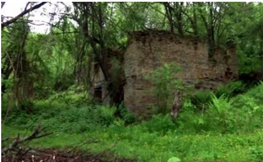
Ратковићи данас – остаци српских кућа

У опису чињеничног стања приликом напада 21. јуна 1992. године на Ратковиће, Горње Ратковиће и Дучиће констатовано је да је напад изведен ујутро 21. јуна, а да су напад извели претходно наведене муслиманске формације, а да су се у селима налазили цивили и припадници сеоских стража. Напад је кратко трајао и муслимани су на отпор наишли само у Горњим Ратковићима. Послије напада Горњи Ратковићи, Полимићи и дио Дворишта били су у пламену, а из Ратковића се дизао дим. До краја дана све зграде у селу Ратковићи спаљене су до темеља, а у Горњим Ратковићима, Полимићима и Дворишту није било ни једног крова, штета је била стопостотна. 8