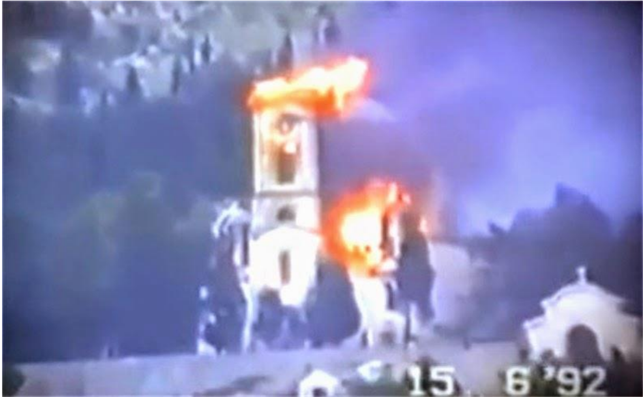
Саборни храм Свете тројице у Мостару након што је запаљен 15. јуна 1992. године

Трећи правац напада у операцији „Липањске зоре“ хрватско-муслиманске снаге су извеле у рејону села Горњи Јасењани. У селу је тада било свега око двадесетак војно способних мушкараца који су били организовани у сеоске страже и који су покушали да пруже отпор непријатељу. Међутим, због бројчане надмоћи хрватско-муслиманске снаге су ушле у Горње Јасењане и том приликом су запалили село. Из села су се тада српски цивили извлачили. Ипак, у Горњим Јасењанима је остало пет жена и један мушкарац. 57