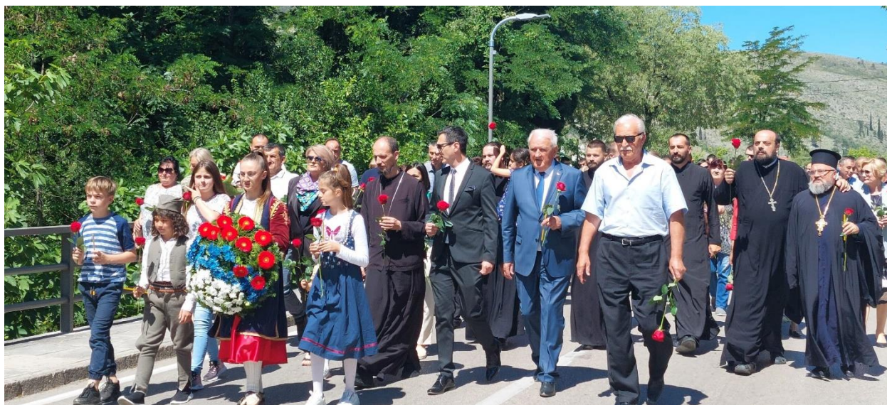
Фотографија с обиљежавања злочина над Србима у Мостару и долини Неретве

Сваке године, 15. јуна, локалне борачке организације и удружења проистекла из Одбрамбено-отаџбинског рата организују обиљежавање страда српских војника и цивила у Мостару и долини Неретве. Такође, 15. јун се обиљежава као дан несталих Источне Херцеговине. Тога дана се са моста на Буни, гдје су побијени српски војници и цивили 14. и 15. јуна 1992. године, бацају руже у ријеку Буну у част убијених.