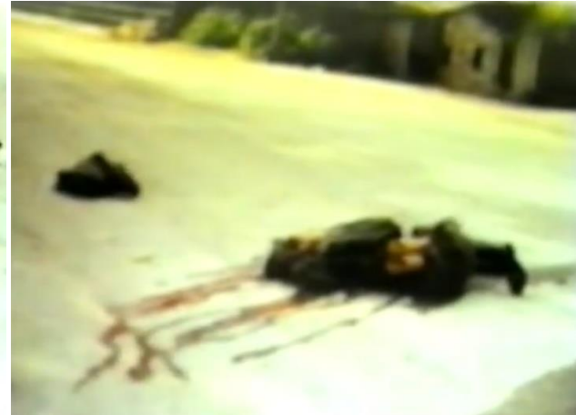
Фотографије убијених Срба на мосту на Буни 14. јуна 1992. године

Припадници ХВО-а и хрватске војске активно су нападали и на касарну „Сјеверни логор“ као и на касарну „Конак“. Напад је изведен тако што су у јутарњим часовима хрватско-муслиманске снаге чамцима пребациле своје људство на лијеву обалу Неретве и форсирајући ријеку Неретву