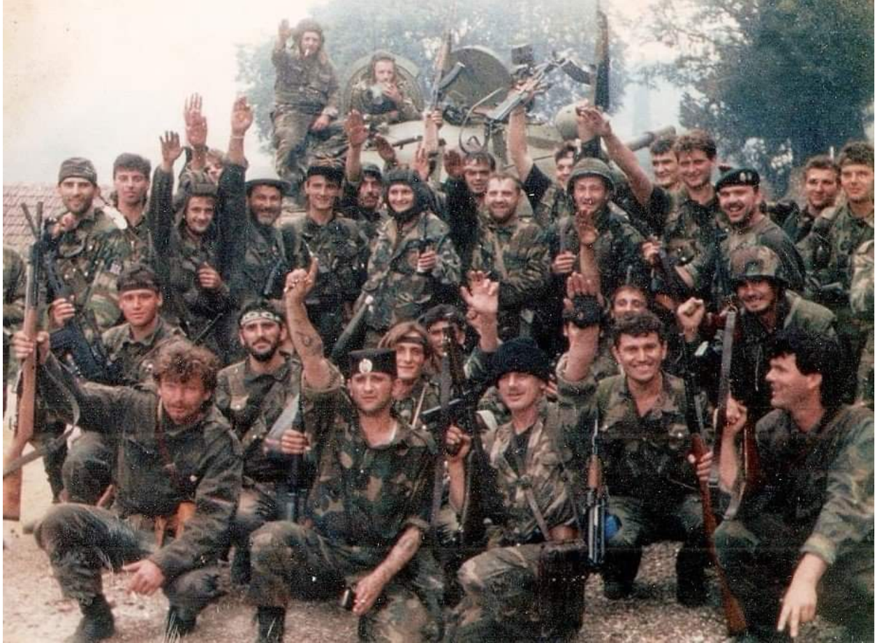
Припадници ХОС-а и 1. гардијске бригаде ЗНГ у Клепцима након заузимања овог села 7. јуна 1992. године