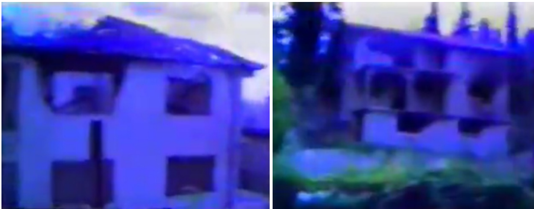
Уништене српске куће у Пребиловцима

Поред прогона и убиства Срба у селима око Чапљине, припадници ХВО-а, ХОС-а и ЗНГ-а, су уништавали српску имовину. Села Клепци и Пребиловци су готово у потпуности била уништена 7. и 8. јуна 1992. године, након уласка поменутих снага у њих. Занимљиво је што су поред уништавања приватних кућа и окућница хрватски војници минирали и спомен-цркву која је била у изградњи у Пребиловцима, а у којој су се налазиле кости убијених Срба из овог села у Другом свјетском рату, а које су извађене из јаме непосредно пред почетак рата.