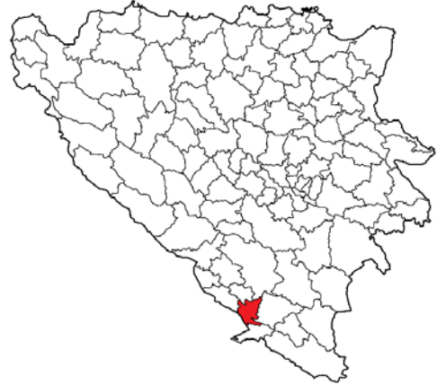
Географски положај општине Чапљина

Општина Чапљина се налази у јужном дијелу Босне и Херцеговине. Граничила се са општинама: Неум, Столац, Град Мостар, Читлук, Љубушки. Површина општине износи 253,74 km 2 . Општина је 1991. године била састављена од 32 насељена мјеста: Бајовци, Бивоље Брдо, Црнићи, Чапљина, Чаљево, Дољани, Домановићи, Драчево, Дретел, Дубравица, Габела, Гњилишта, Горица, Грабовина, Хотан, Јасеница, Клепци, Локве, Опличићи, Почитељ, Прђавци, Пребиловци, Сјецкосе, Станојевићи, Струге, Свитава, Шеваш Њиве, Шурманци, Тасовчићи, Требижат, Вишићи, Звировићи.