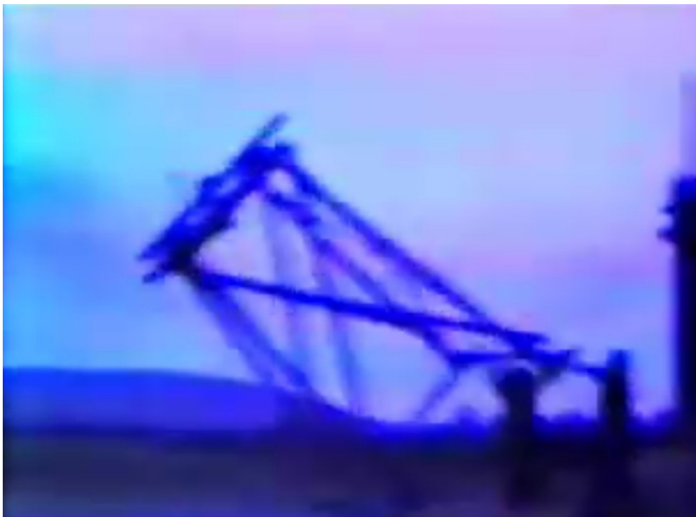
Хрватски војници уништавају звоник у Пребиловцима